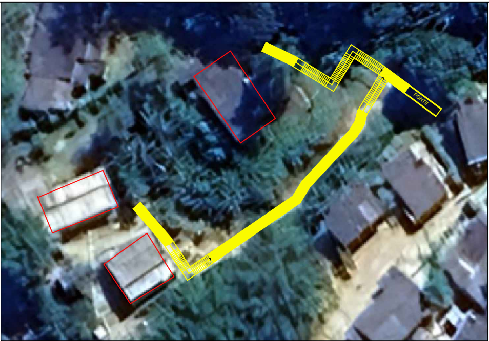
LOCALIZAÇÃO - 22°43'22"S 44°08'50"W SEM ESCALA